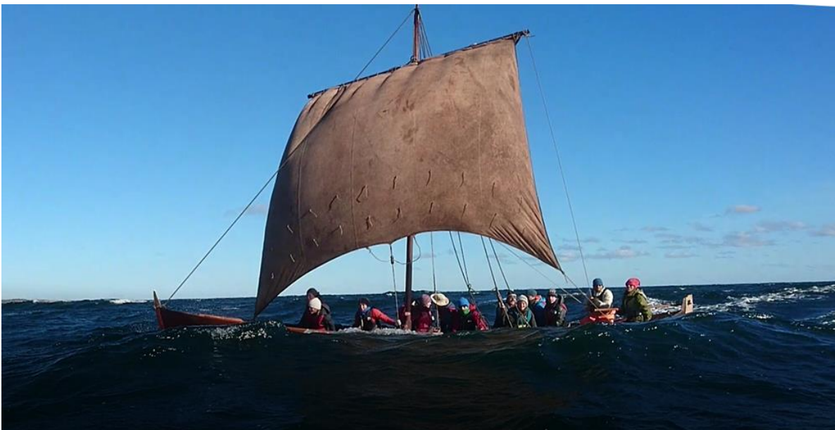
Universitetet i Sydøst-Norge i sejladss med Rival ud for Lyngø Fyr.