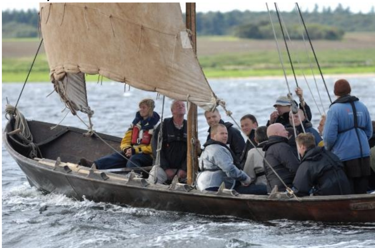
Turistsejls i den norske Oselvaren "Bjørnefjord".