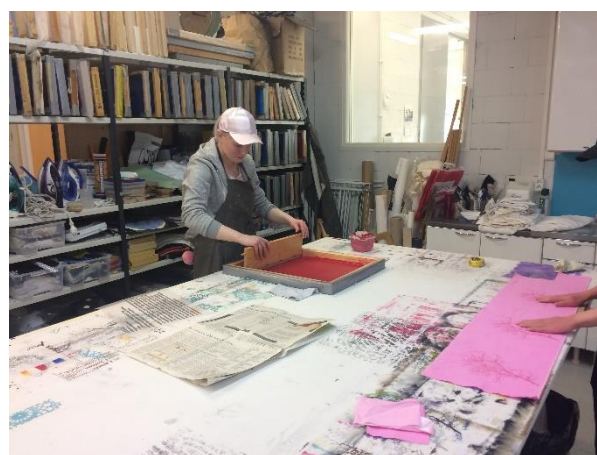
Tekstilværksted på Omnia i Espoo, Finland

Det sidste møde i projektet blev afholdt i Helsinki før sommerferien. Her var et besøg på Omnia workshop i Espoo.